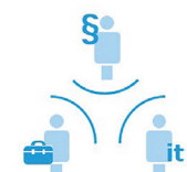
Jurister, fagkyndige og it-folk arbejder hver for sig